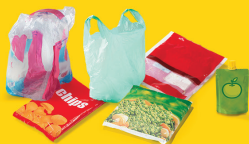
Films, sacs et sachets en plastique