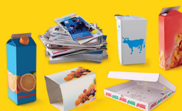
Papiers, cartonnets, briques alimentaires